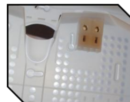
PATERE TRANSLUCIDE MULTIPOINTS