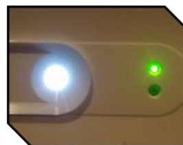
100% LED AUTOTEST SATI